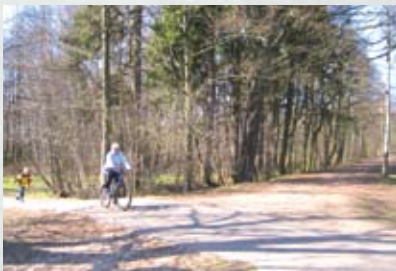
Veloceļš caur Anniņmuižas parku