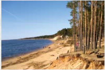
Baltā kāpa pie Lielupes