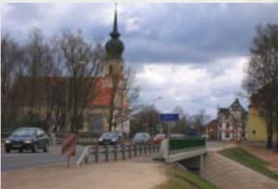
Doles evaņģēliski luteriskā sv. Annas baznīca