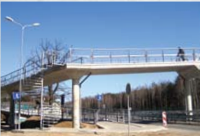
Gājēju un velosipēdistu tilts pāri Kārļa Ulmaņa gatvei