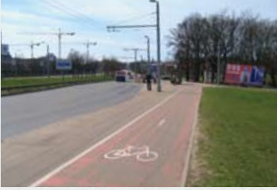
Velomaršruta sākums pie Vanšu tilta