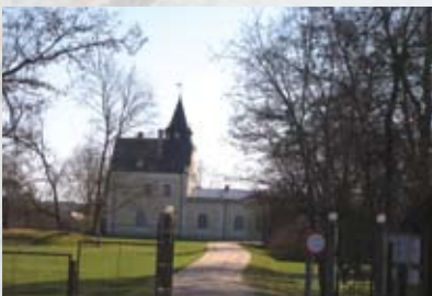
Daugavas muzejs, Doles muiža