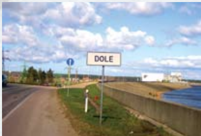
Doles sala, Rīgas HES aizsprosts