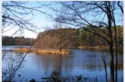
Beberbeķu dabas parks