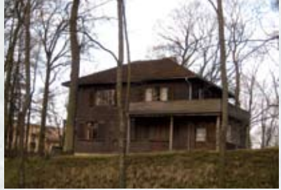
Jāņa Akurātera muzejs