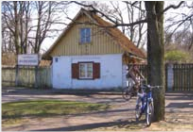
Latvijas Universitātes Botāniskais dārzs