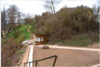
Ķekavas avotiņa vieta