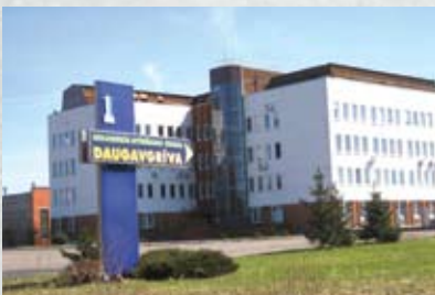
Attīrīšanas stacija "Daugavgrīva"