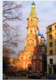
Svētās Trīsvienības pareizticīgo baznīca