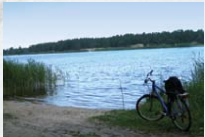
Skats uz Vakarbuļļu dabas liegumu