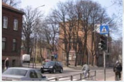
Daugavgrīvas-Kliņģeru ielas krustojums