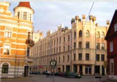
Nams Meža ielā (gotikas eklektisma paraugs)