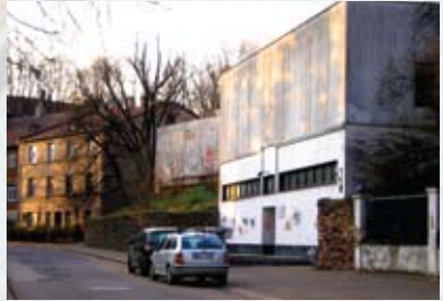
Eduarda Smiļģa teātra muzejs