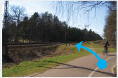
Pagrieziena uz Beberbeķu ielu