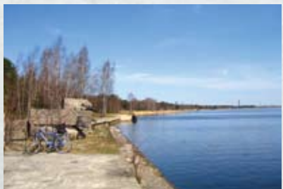
Bijusī militārā kuģu piestātne, Buļļupe