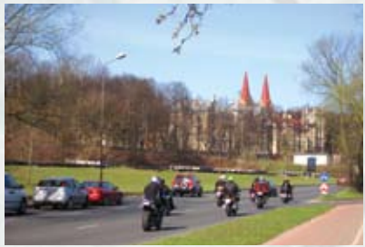
Maršruta sākums, Daugavgrīvas iela