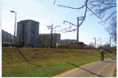
Velocliņš "Centrs - Imanta"