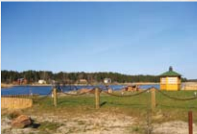
Buļļupe pie Vārnukroga