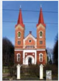
Evanģēliski Luteriskā Mārtiņa baznīca